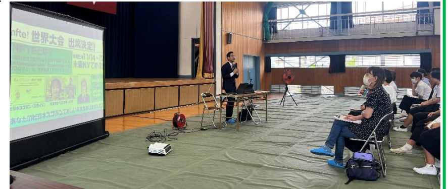
<尾道商業高校の学校説明場面より>

6月28日に、高校説明会を行いました。今年度は2・3年生と保護者の皆様にお集まりいただき、6校(尾道商業高校、如水館高校、沼南高校、福山明王台高校、尾道東高校、尾道高校)の先生方から、高校の特色や中学校で身に付けておいてもらいたいこと・大事にしてほしいことなどを話していただきました。自分の将来を考えはじめた最適な時期に、この説明会が契機となれば良いですね。その一歩は、今は小さくても、これから強く、そして確実なものにしていきましょう。